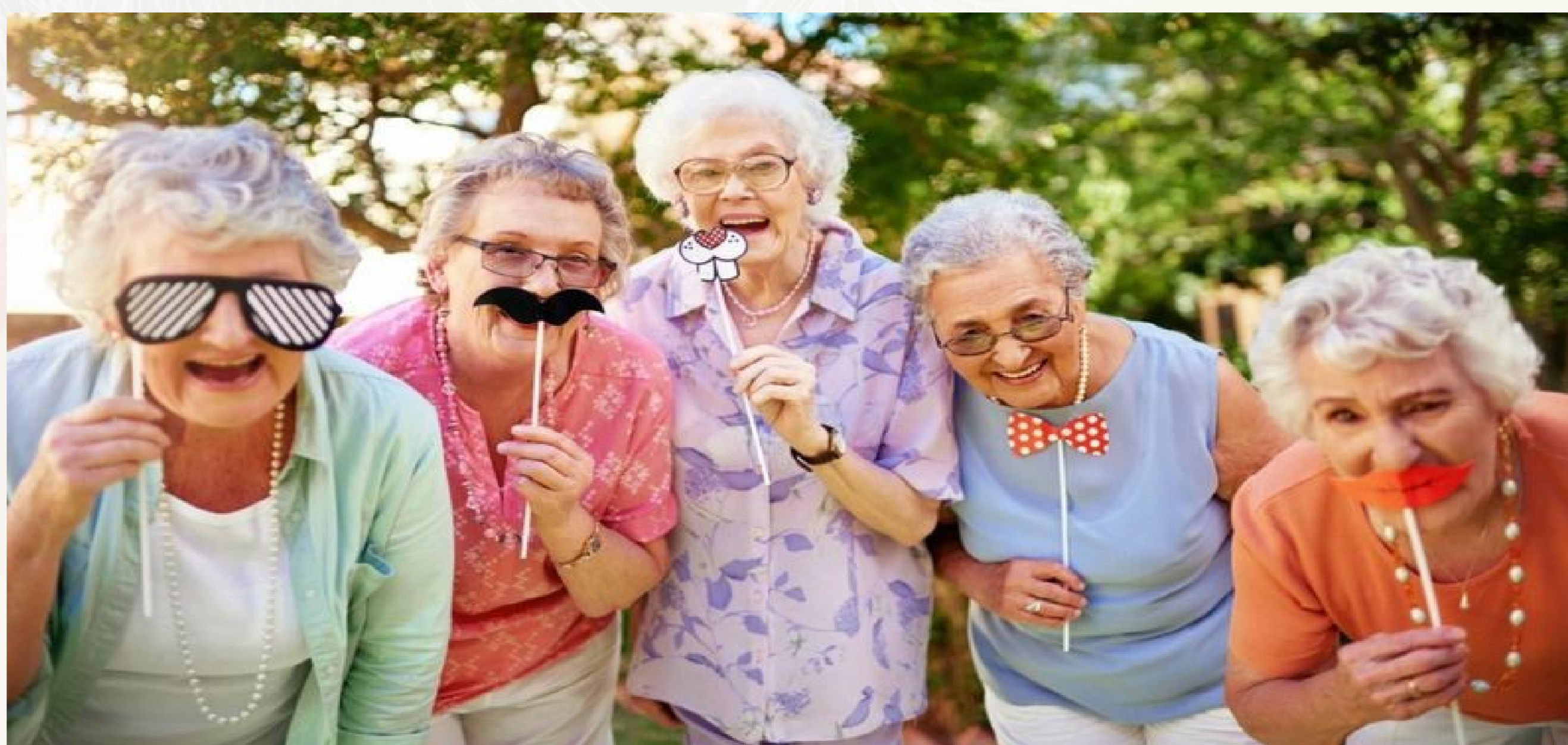
Imatge 2 VIDA ACTIVA I SALUDABLE