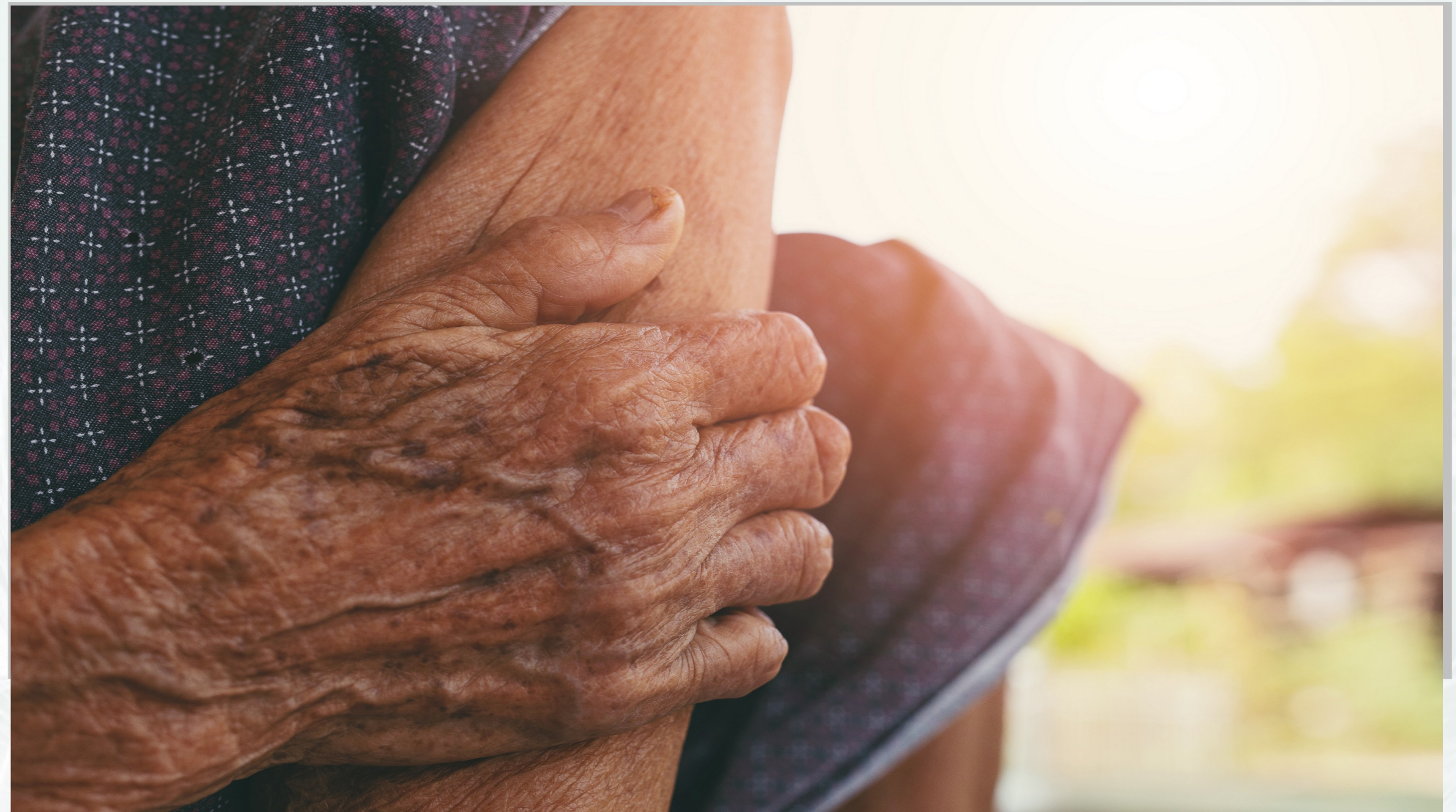
Imatge 1 L'ENVELLIMENT DE LA POBLACIÓ

La satisfacció dels usuaris amb els grups actuals en funcionament, fa que la mateixa societat cada cop sol·liciti més serveis i grups. Això comporta cada cop més volum de serveis per part dels usuaris envellits.