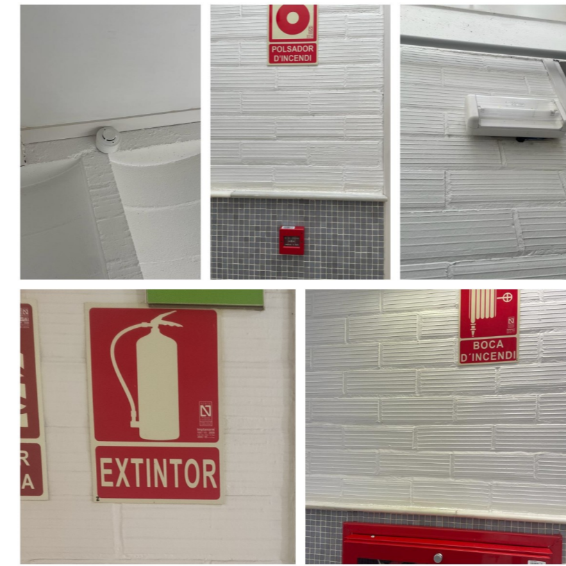
Mitjans materials d'autoprotecció

Minimitzar els riscos i conseqüències davant un accident o emergència en el centre gràcies a una major planificació de les tasques del personal davant d'aquest tipus de situacions.