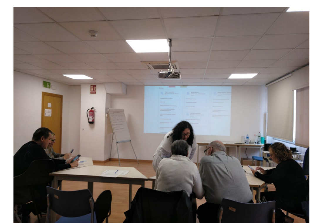
Grups de programació per motius i la meua salut