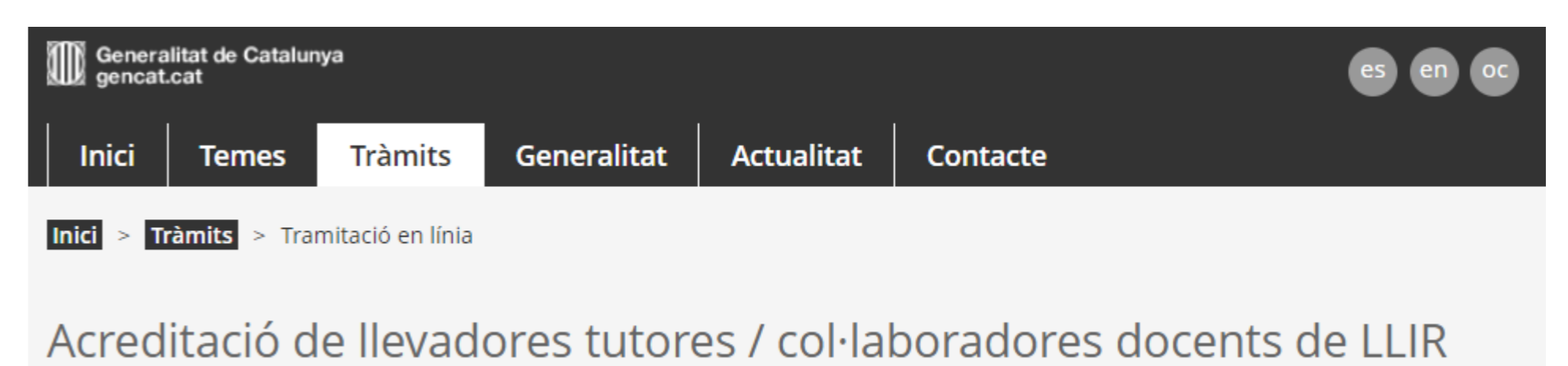
Figura 1: Formulari acreditació gencat.cat