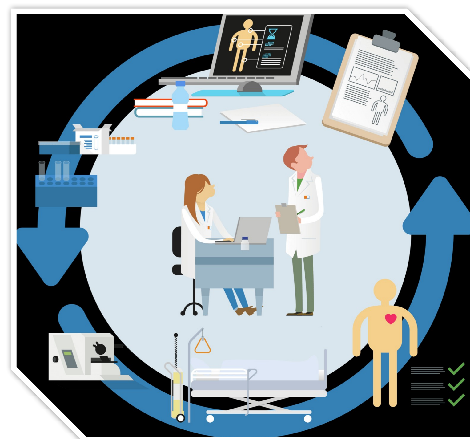
L'administratiu coneix els protocols del centre.