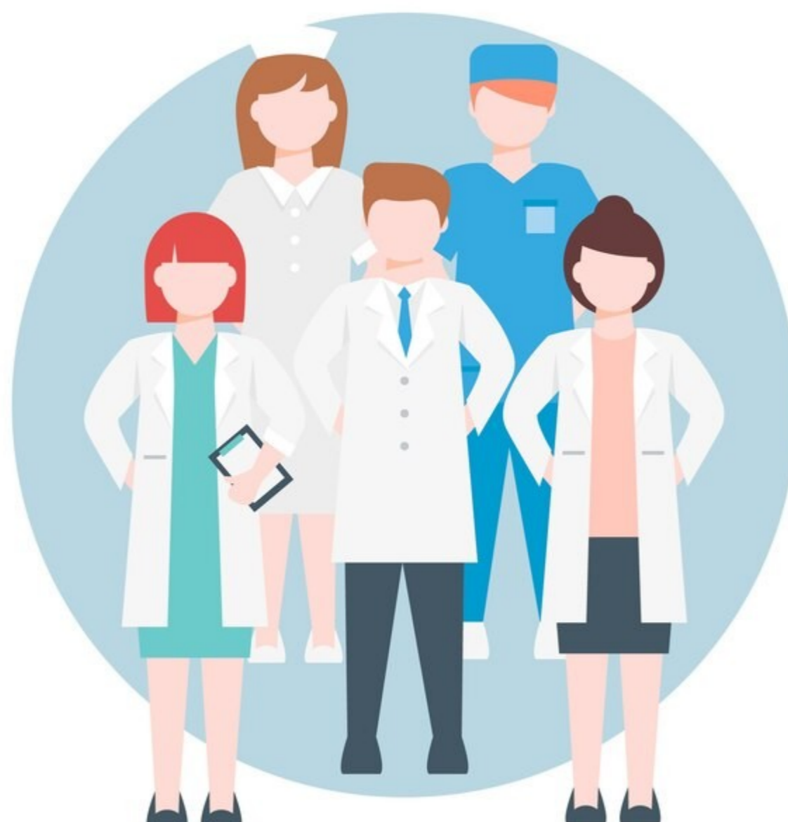
La unitat fa la força