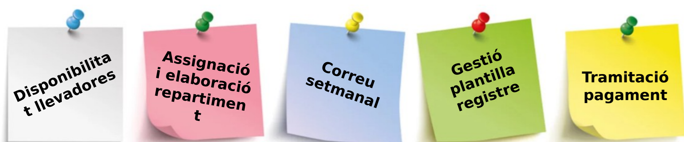
Figura 1. Tasques administratives circuit

Per poder realitzar aquesta tasca s'ha definit el circuit d'atenció al puerperi domiciliari amb una gestió administrativa cabdal per al seu bon funcionament.