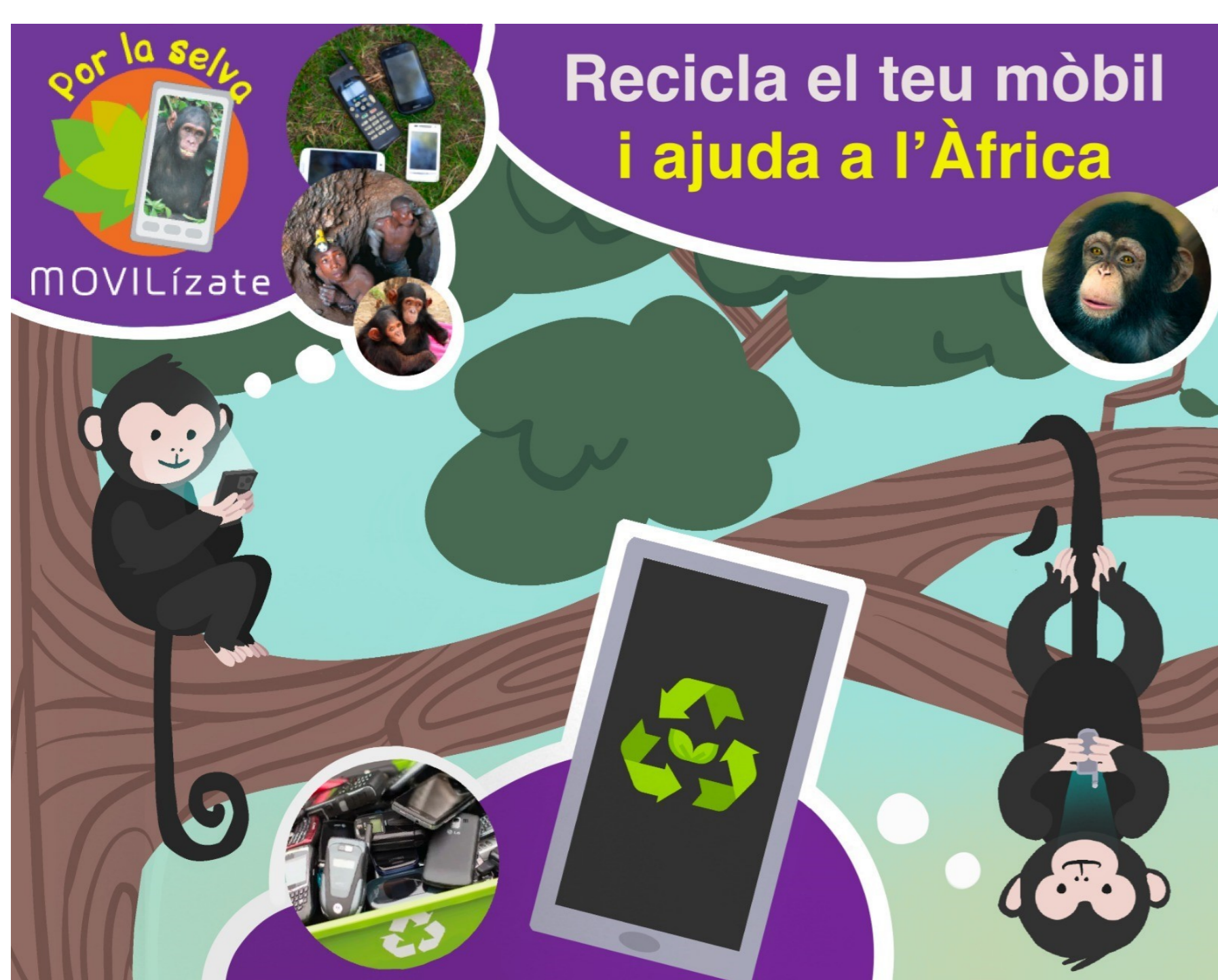
Figura 2: Cartell campanya reutilització de mòbils Gerència Territorial Terres de l'Ebre