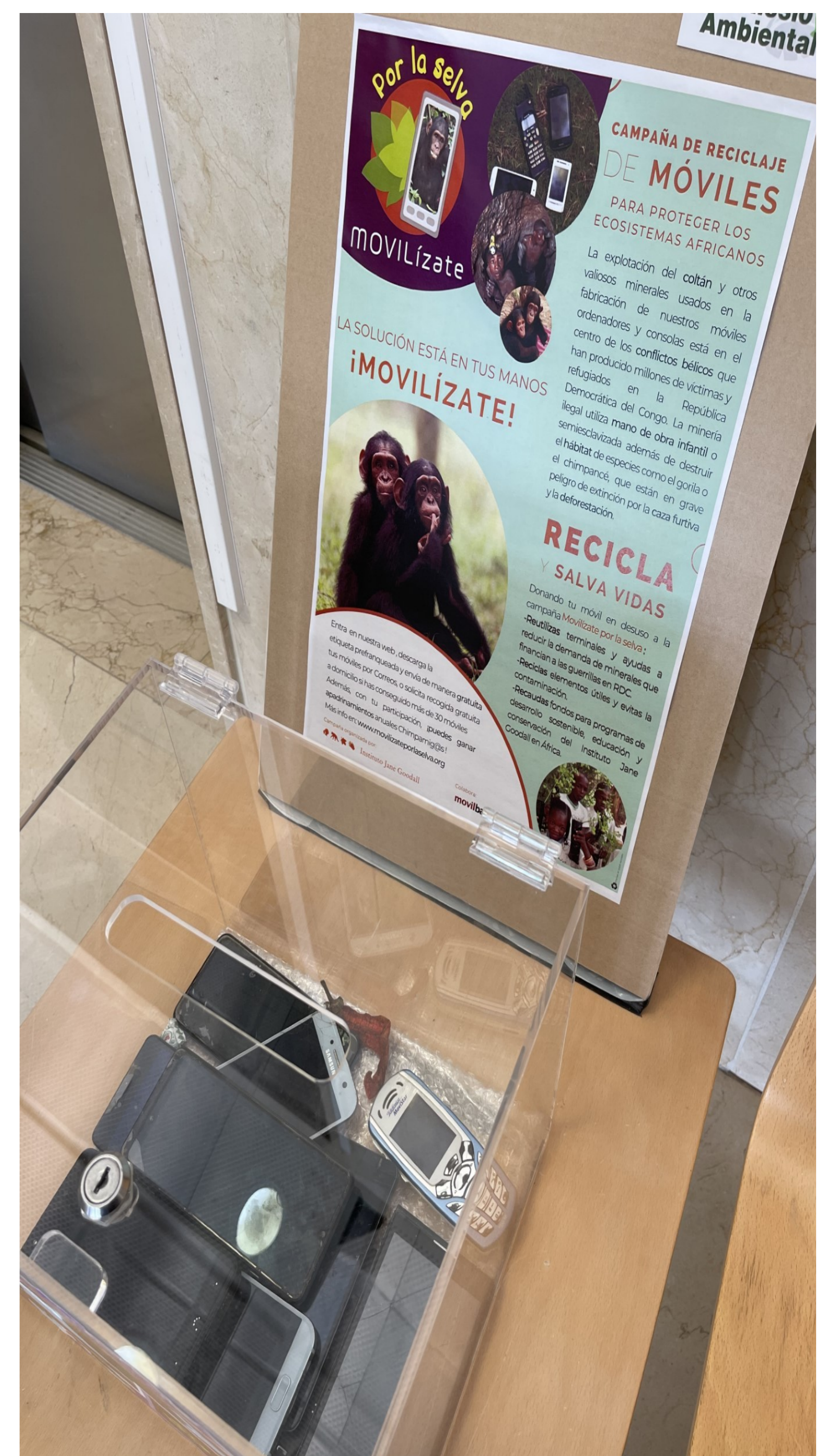
Figura 4: Urna ambulant de recollida de mòbils Gerència Territorial Terres de l'Ebre