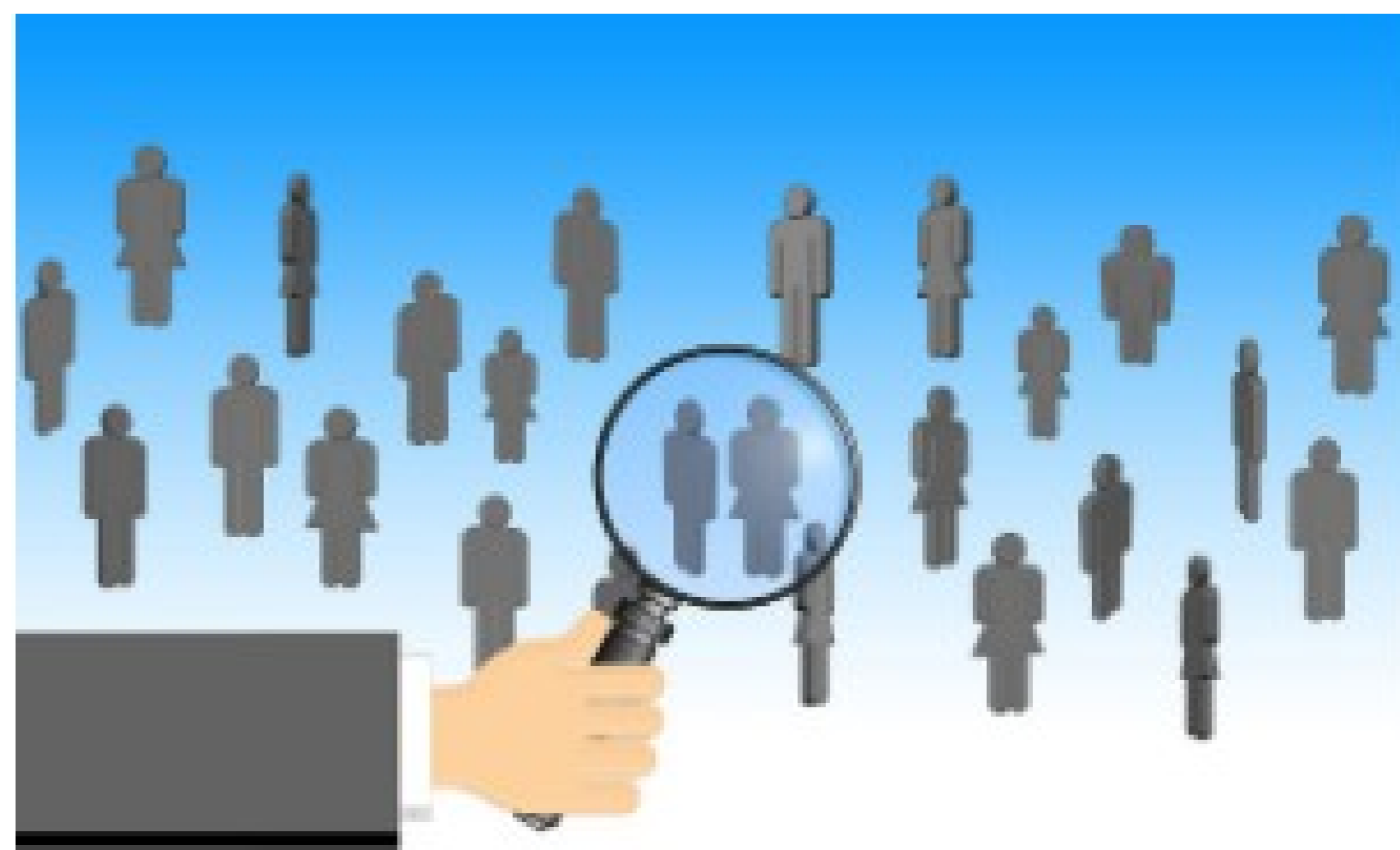
Atenció al ciutadà

Una atenció per part de l'administratiu de referència centrada en la seva població assignada ha millorat la planificació, l'organització, la gestió i la resposta a la seva demanda.