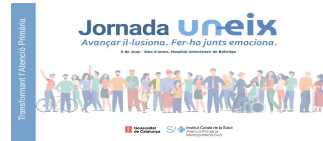
Avançar il·lusiona Fer-ho junts emociona