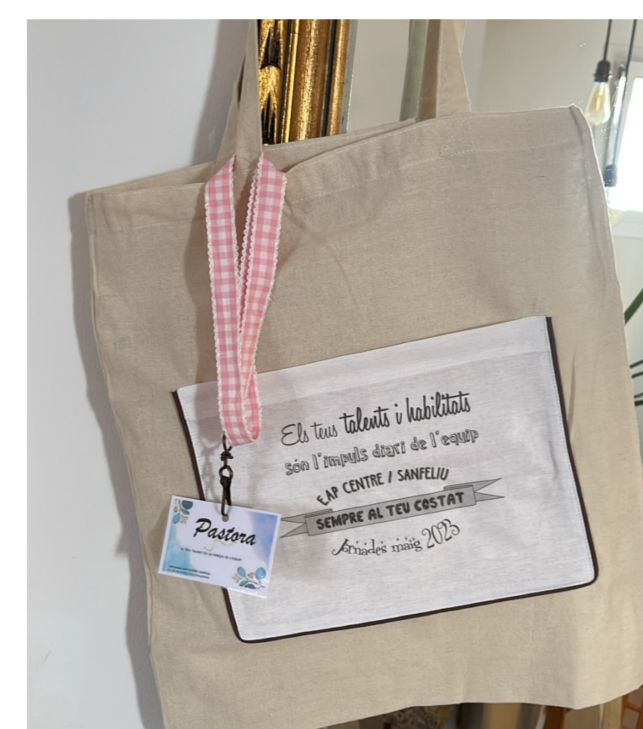
Regal coaching equip