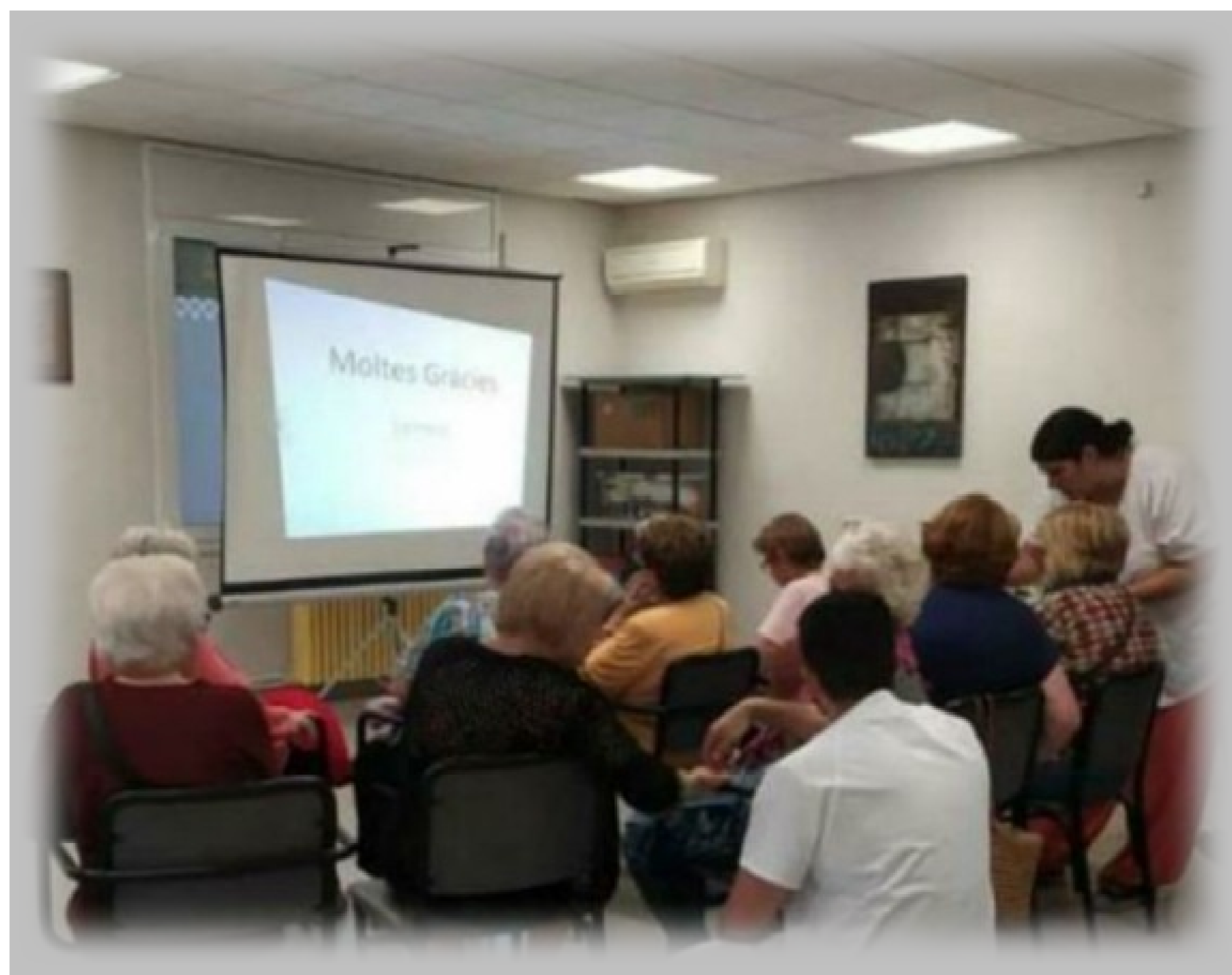
El 9 de maig del 2023 es va realitzar un taller al Casal d'avis de Masquefa on es va explicar als usuaris com interactuar amb l'aplicació de La Meva Salut.

Els resultats d'aquestes experiències han estat molt positius, ja que molts dels participants adquireixen habilitats per utilitzar les noves tecnologies de manera autònoma. A més, aquests tallers han provocat una major demanda de formació i una major inscripció a serveis de salut electrònica entre els adults majors i s'ha ampliat la demanda d'inscripcions a "La Meva Salut" a la franja d'edat de majors de seixanta-cinc anys.