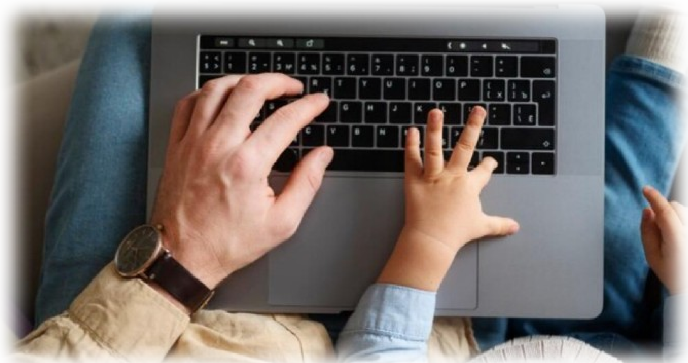
Intentem minimitzar la bretxa digital de la gent gran cap als seus fills o familiars més joves per fer-los el més independents possibles.