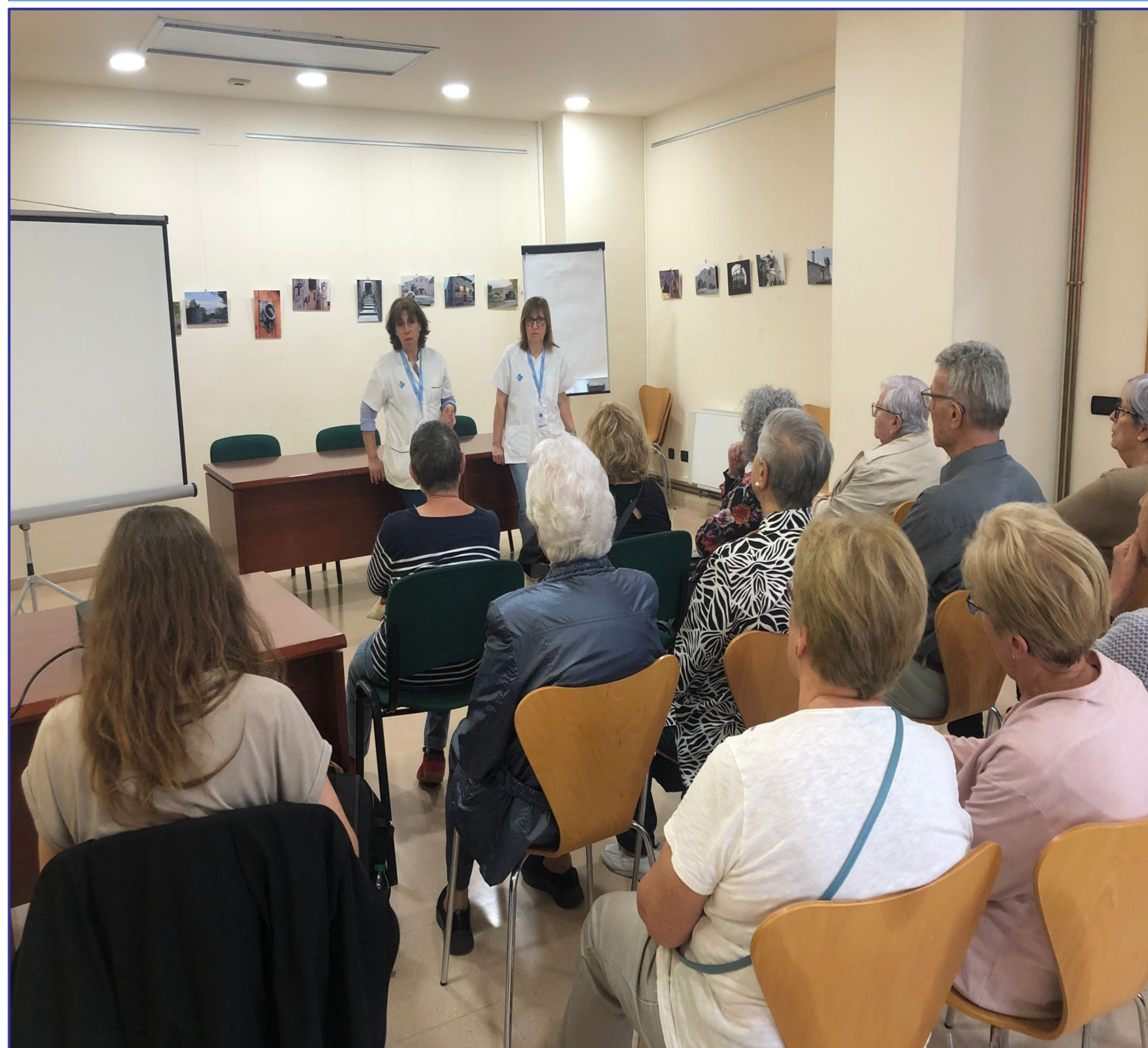
Figura 2. Fotografia de la xerrada realitzada a la Sala de plens de l'Ajuntament de Copons.