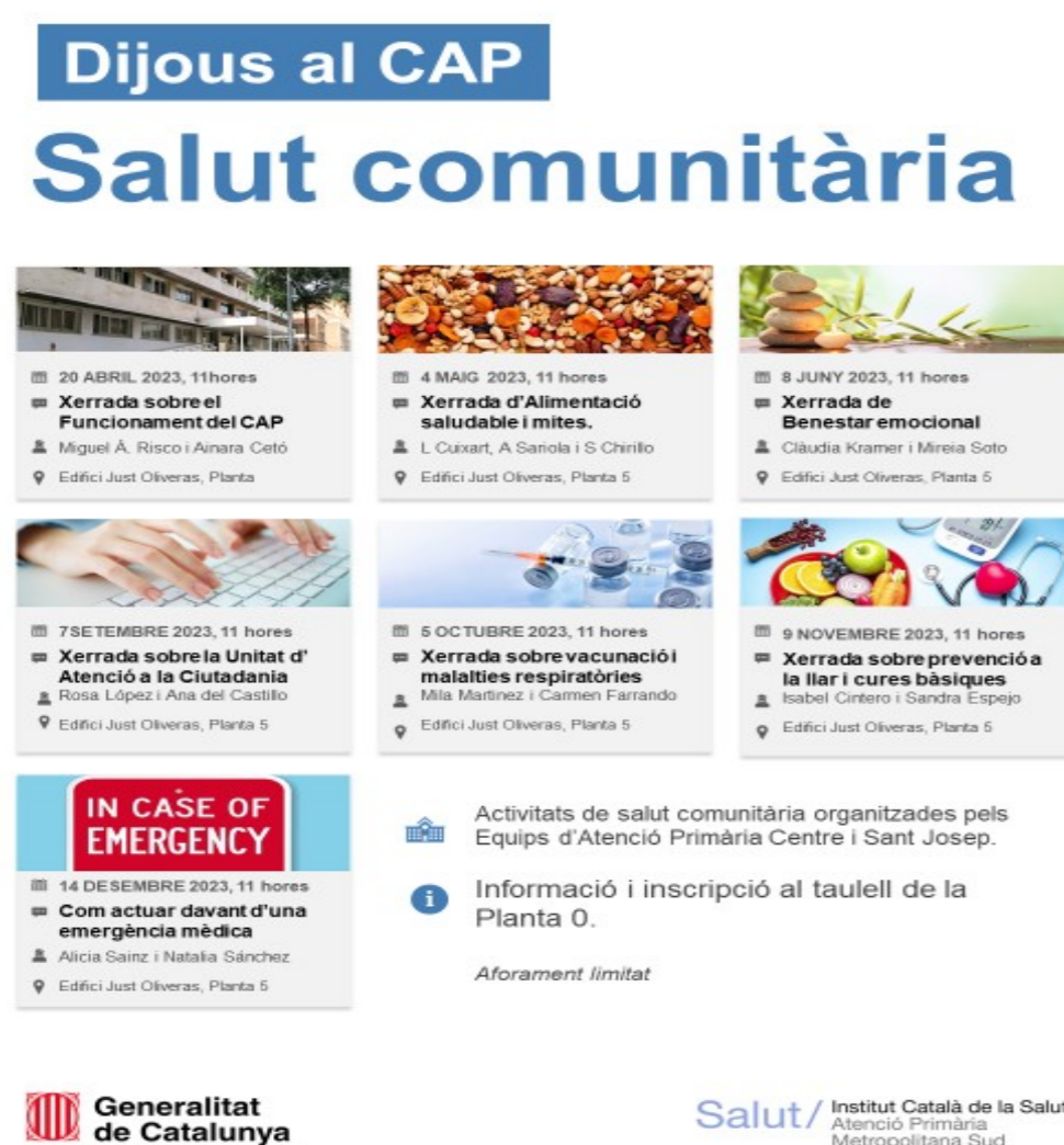
Figura 1: Cartell informatiu de les xerrades.

Aquestes xerrades són impartides per administratives, infermers/es, metgesses, nutricionistes, psicòlogues i fisioterapeutes del nostre centre que de manera voluntària col·laboren en les sessions planificades pel Grup motor de Comunitària.