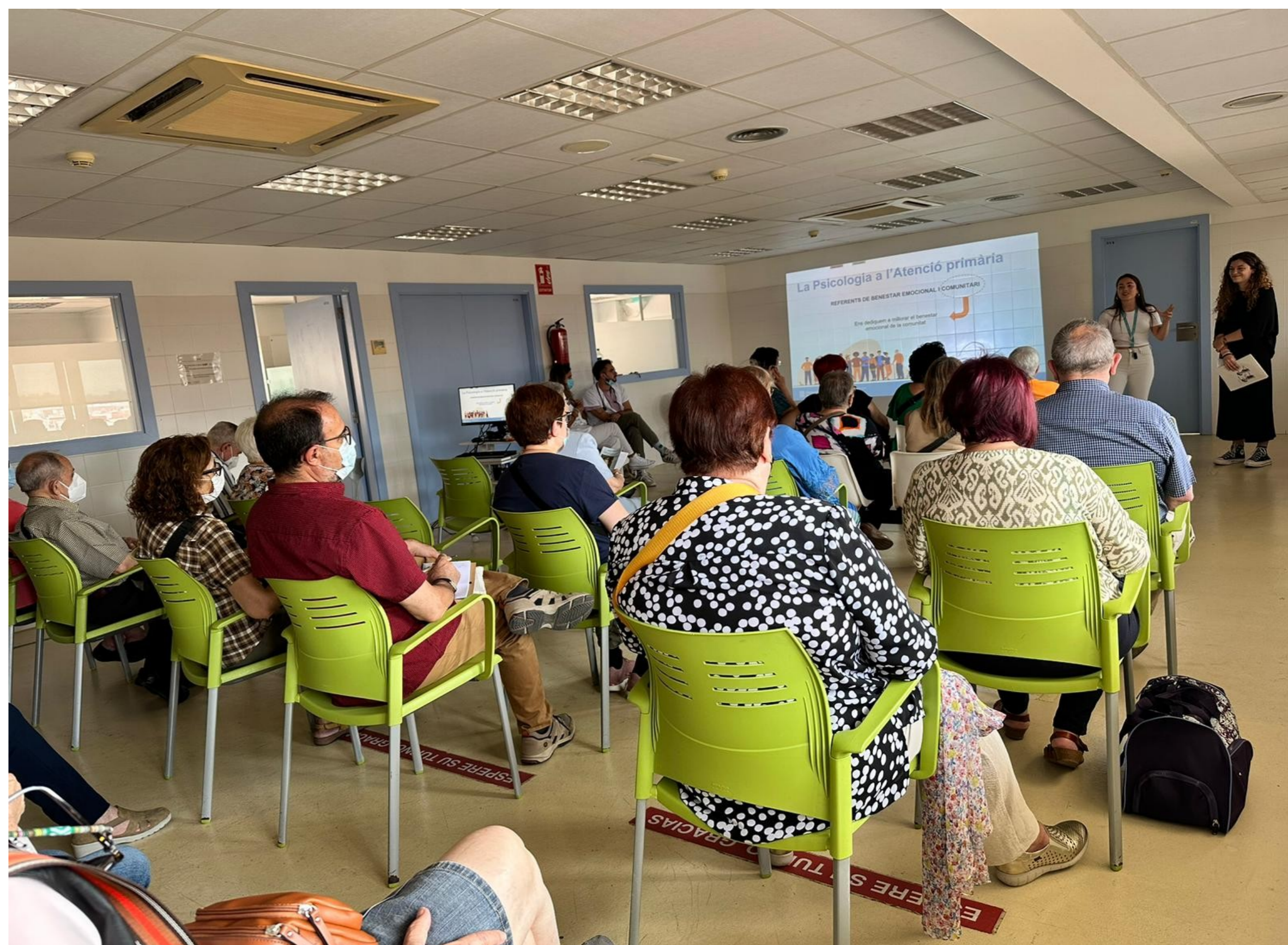
Figura 2: Xerrada de Benestar Emocional.