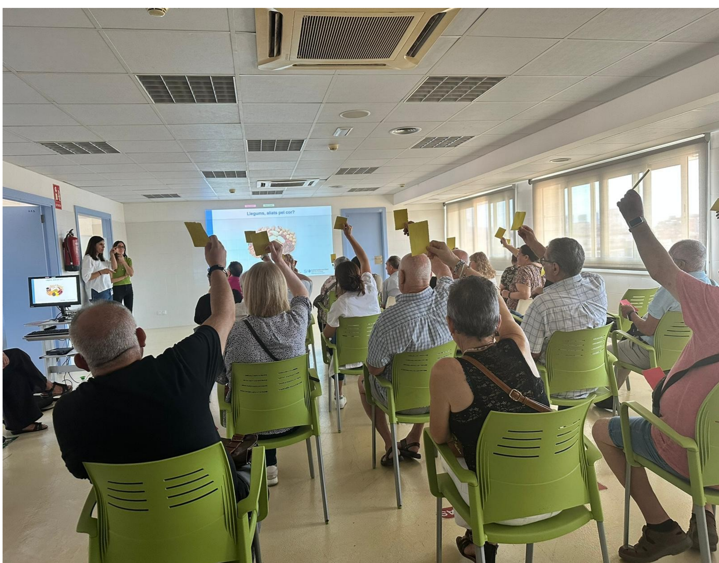
Figura 3: Usuaris interactuant en la xerrada de Alimentació saludable i mites